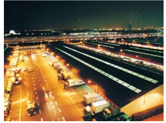
●物流の拠点となるトラックターミナル

ネットワークをいかした高度情報システムなど、新しい時代に対応した効率化が積極的に進められているんだよ。