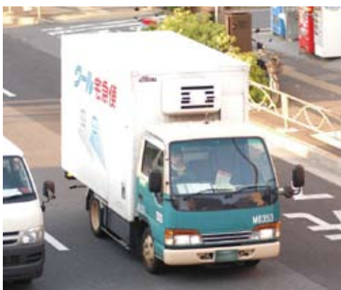
●くらしに密接な宅配便

トラック輸送の分野でも、物流施設の整備をはじめ、トラックの大型化、道路網の拡大、共同運行・集配、コンピュータ・ネ