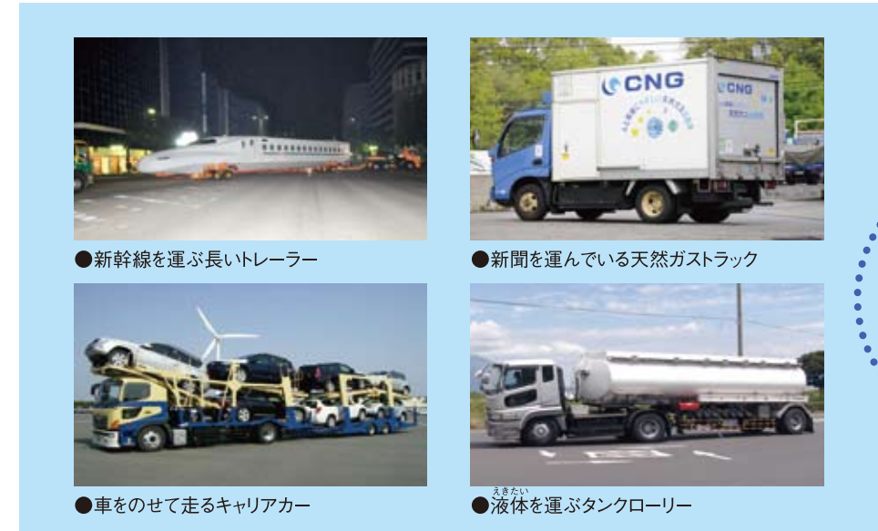
●新幹線を運ぶ長いトレーラー